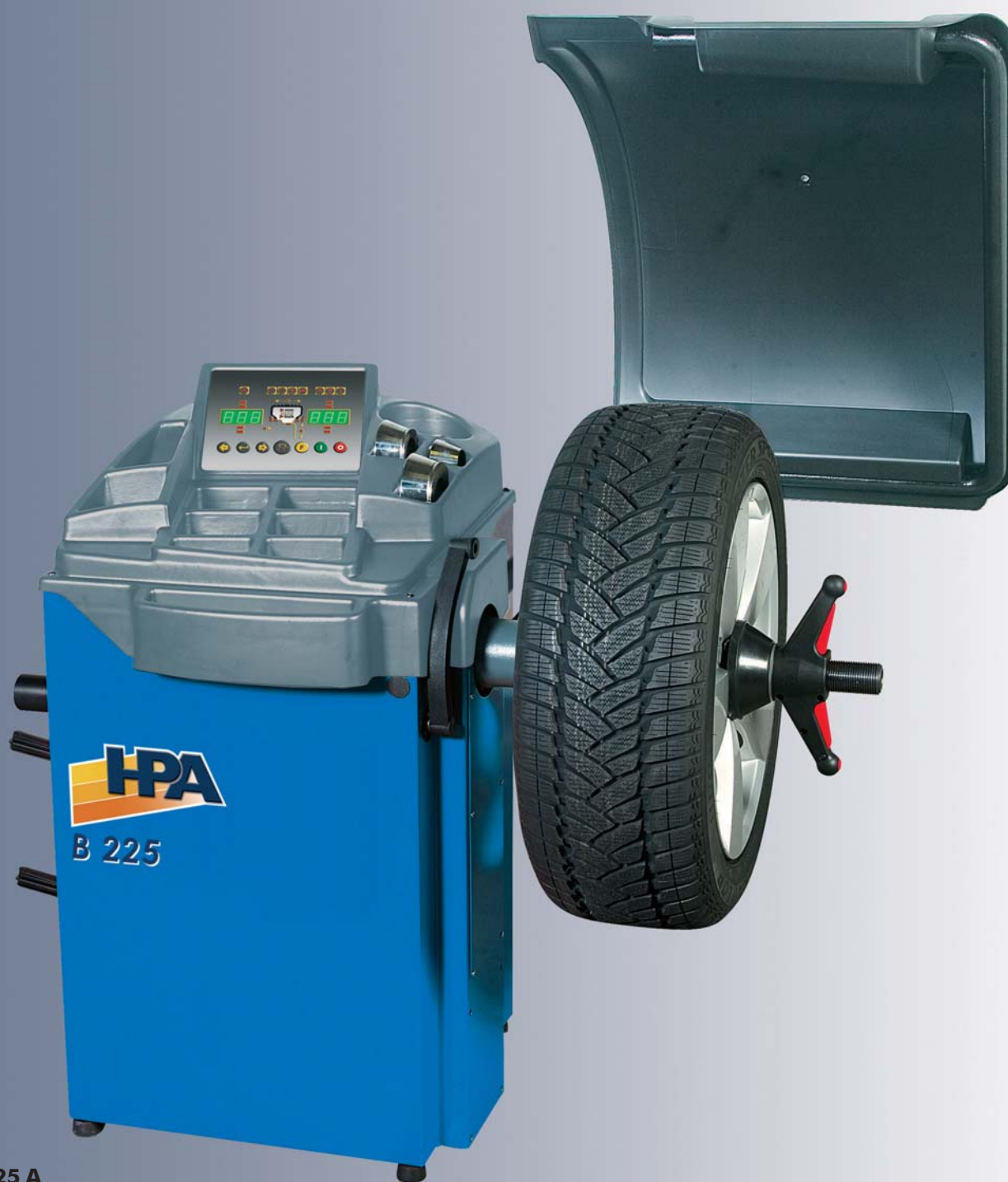
B 225 A